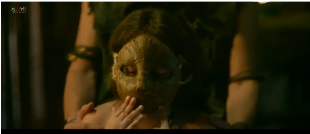
Gambar 1: Topeng pertama Tombiruo semasa kanak-kanak.

Tombiruo mengenakan tiga topeng berbeza sepanjang jalan cerita. Topeng pertama adalah semasa zaman kanak-kanaknya, kedua; topeng yang dipakai pada waktu sekarang, iaitu Tombiruo dewasa dan ketiga; topeng baharu yang diukir sendiri oleh Tombiruo. Topeng ketiga ini amat berbeza jika dibandingkan dengan topeng pertama dan kedua. Perbezaannya adalah dari segi kematangan dan ekspresi topeng yang dipakai oleh Tombiruo sepanjang filem. Topeng pada zaman kanak-kanaknya menunjukkan permukaan yang licin dengan garisan halus. Topeng tersebut lebih berupa wajah kera yang menampakkan dahi, mulut dan hidung. Sementara itu, topeng Tombiruo dewasa pula lebih jelas memaparkan rekahan berbanding dengan topeng zaman kanak-kanaknya. Topeng ketiga pula lebih mirip wajah manusia dengan garis rekahan lebih dalam serta menampakkan bentuk mulut, kening dan hidung.