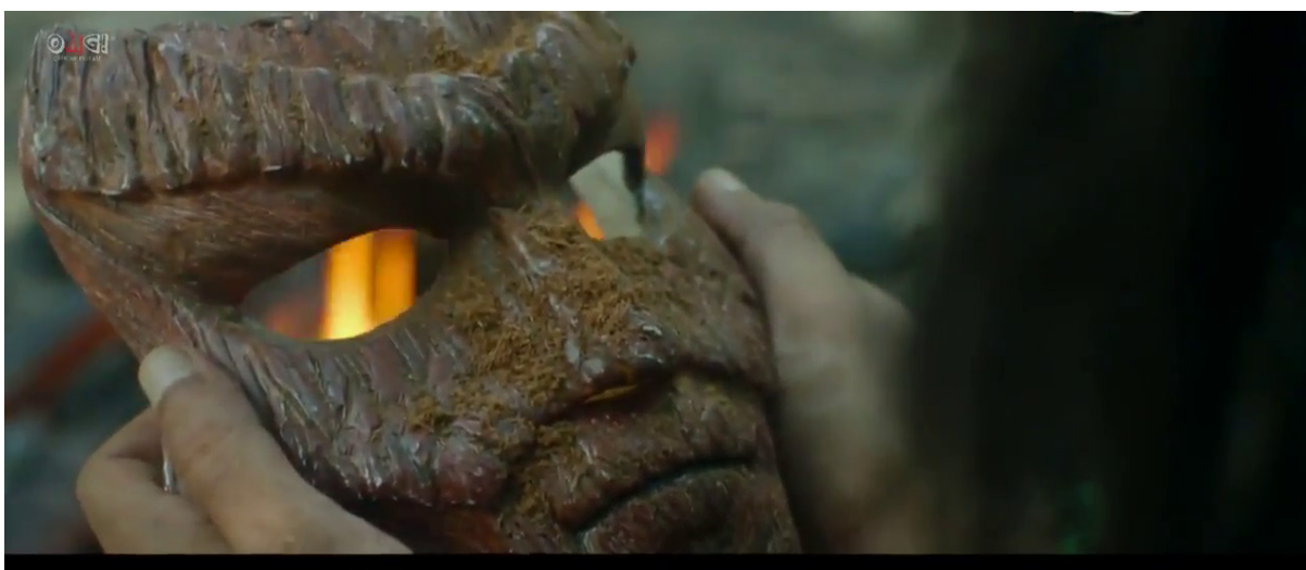
Gambar 3: Topeng Ketiga Tombiruo.

Kehidupan masyarakat pedalaman dalam filem TPR sangat bergantung kepada sumber alam sekitar. Masyarakat ini memiliki kearifan lokal dalam memelihara dan melestarikan alam sekitar (Minah Sintian, 2013). Kearifan lokal dikaitkan dengan budaya tertentu dan mencerminkan kehidupan sebuah masyarakat. Hal ini dipaparkan melalui aktiviti mereka seperti penternakan dan menangkap ikan. Misalnya, Pondoluo menggunakan serkap, iaitu sejenis alat yang diperbuat daripada buluh untuk menangkap ikan di sungai. Monsiroi memberi seekor kerbau kepada seorang penduduk kampung sebagai bayaran sogit , manakala watak Pondolou pula dipaparkan sedang menangkap ikan ketika menemui bayi yang dihanyutkan di sungai. Selain itu, aktiviti menangkap ikan dan penternakan, seluruh kehidupan masyarakat pedalaman Kadazan-Dusun dalam filem ini menunjukkan kebergantungan kepada alam sekitar. Bagi meneruskan kelangsungan hidup, masyarakat Kadazan-Dusun mencari sumber alam yang terdapat di persekitaran mereka untuk mendirikan rumah. Perkara ini jelas dipaparkan pada babak serangan ke atas penduduk kampung oleh penceroboh. Kediaman masyarakat ini diperbuat daripada bahan-bahan hutan seperti batang pokok, daun mengkuang atau pelepah.