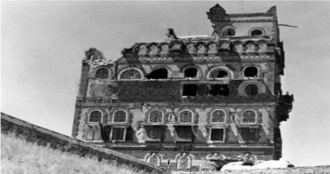
Gambar istana Al-Badr, sehari selepas serangan meriam kereta kebal pada September 1962. 7

Kumpulan pemberontak yang diketuai oleh Abdullah bin Sallal ini menjadikan pemimpin Mesir iaitu Jamal Abdul Nasser sebagai idola bagi melakukan rampasan kuasa daripada pemimpin kerajaan Imāmah di Yaman Utara pimpinan Al-Badr. Rampasan kuasa di Yaman Utara mula dilancarkan pada tanggal 26 September 1962. 6 Istana yang diduduki Al-Badr dikepung dari segenap penjuru oleh tentera pemberontak menggunakan kereta kebal dan sebagainya. Bedilan demi bedilan meriam kereta kebal dilancarkan oleh tentera pemberontak bagi memaksa Al-Badr menyerahkan kuasa kepimpinan Yaman Utara kepada Abdullah bin Sallal. Berikut merupakan gambar istana Al-Badr yang dibedil oleh tentera pemberontak: