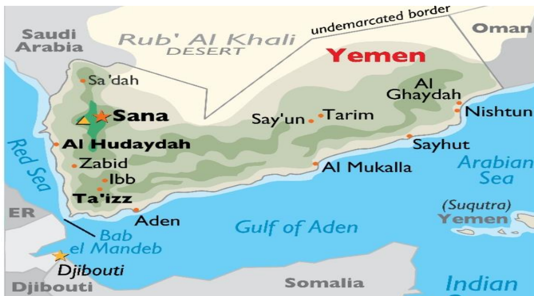
Sumber: ATLAS, "World Atlas: Yemen". 3

Bukit atau Jabal Nabi Syaib menjadi titik tertinggi di negara dengan ketinggian sekitar 3,760m dari aras laut. Keluasan negara ini adalah sekitar 527,970 kaki persegi kilometer (km) dengan termasuk termasuk persisir pantai sepanjang 2,000 km. Yaman dikatakan mempunyai kedudukan yang strategik kerana negara ini berada di laluan masuk Terusan Bab al-Mandab. Bab al-Mandab merupakan terusan yang menjadi laluan penghubung antara Laut Hindi dan Laut Merah melalui Teluk Aden. 2 Berikut merupakan peta sempadan terkini bagi Yaman: