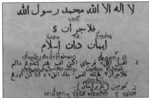
Gambar 3: Cara pelajar memahami isi kandungan pelajaran yang dipelajari